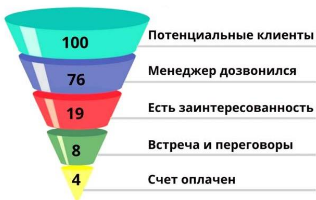
Рисунок 2 – Структура и состав воронки продаж на рынке B2B, % [5]

Если на рисунке отражены показатели, то после заголовка рисунка через запятую указывается единица измерения, например: