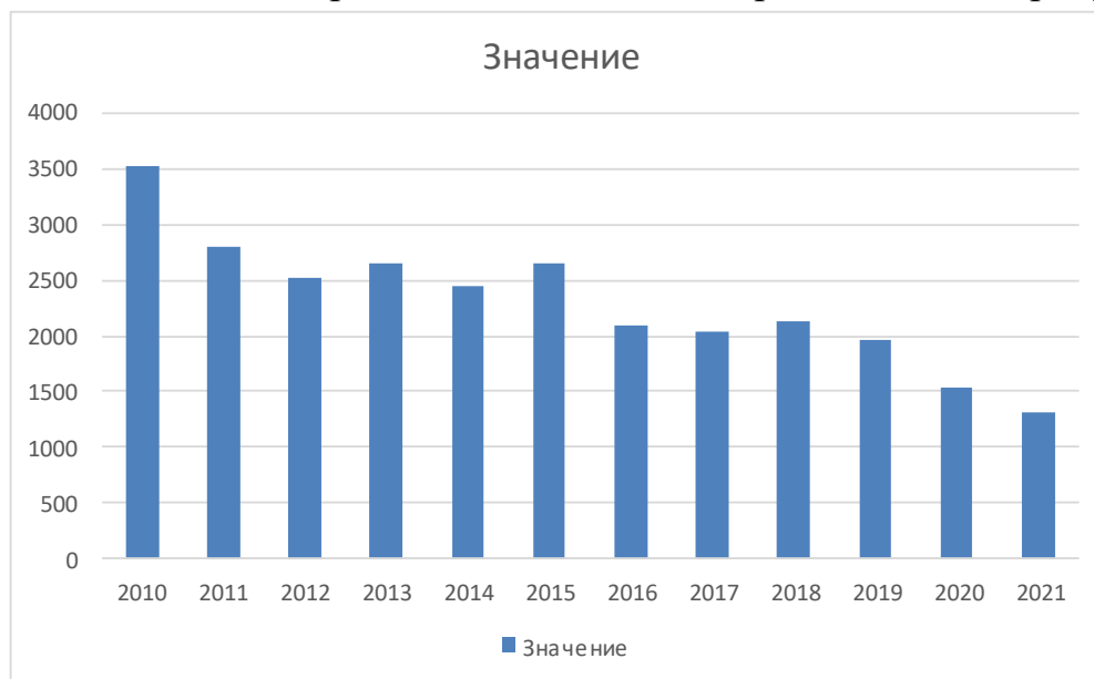
Рисунок 1 – Статистика преступлений, совершенных несовершеннолетними в Свердловской области за период 2010-2021 годы (составлено автором)

Наглядно статистика преступлений, совершенных несовершеннолетними в Свердловской области за период 2010-2021 годы, представлена на рисунке 1.