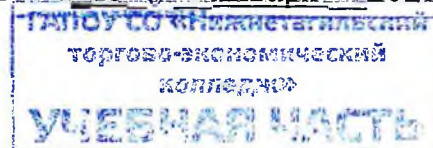
График консультаций по выполнению дипломной работы на 2025-2026 учебный год

студентов специальностей 38.02.04 Коммерция (по отраслям)